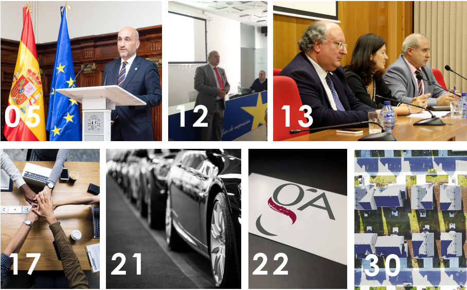
COLEGIO DE GESTORES ADMINISTRATIVOS DE CASTILLA Y LEÓN