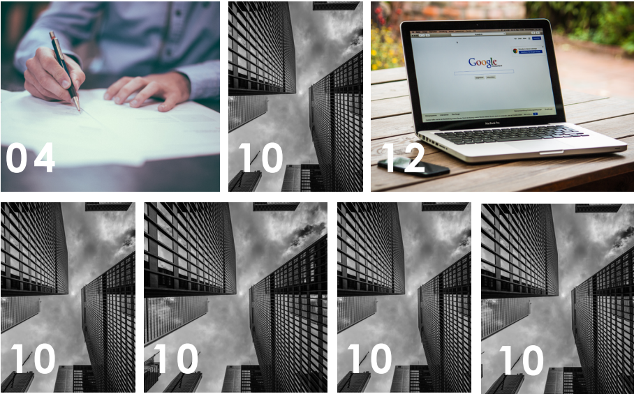
COLEGIO DE GESTORES ADMINISTRATIVOS DE CASTILLA Y LEÓN